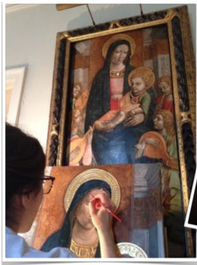
Aesthetic and chromatic control sessions