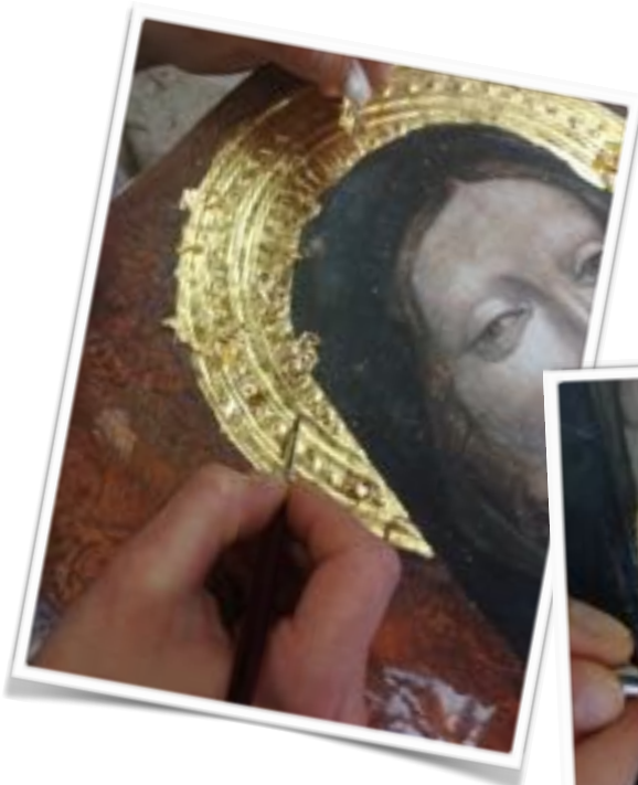
Details of gilding session

The gilding has been performed 'a guazzo' (water gilding), using French red bole, fish glue and pure gold leaf 23 \frac{3}{4} kt. All the surface has been polished and eventually the gold layer has been gently scraped off in certain places letting the red bole appear so as to exactly match the original masterpiece condition.