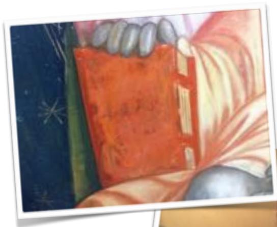
Details of the paintings phase