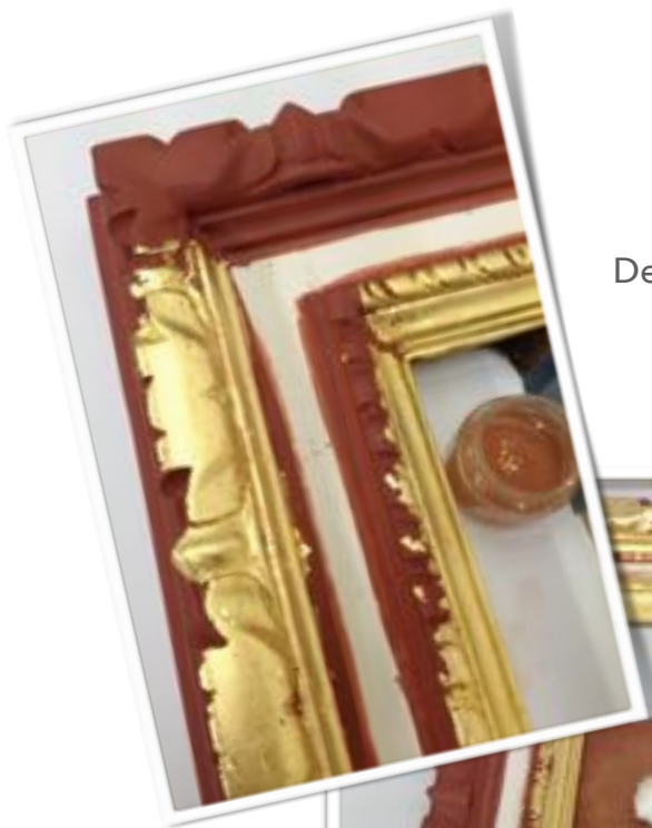
Details of gilding phase.

The frame has been treated with gilding gypsum (gesso di bologna and rabbit skin glue) to fill the flaws of the wood. It has then been layered with French red bole, gilded with solid gold leaf 23 ¾ kt. and chiselled.